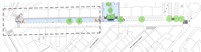
PLANTA GERAL DE IMPLANTAÇÃO ESCALA 1/1000