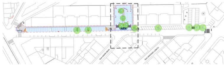
PLANTA GERAL DE IMPLANTAÇÃO ESCALA 1/1000